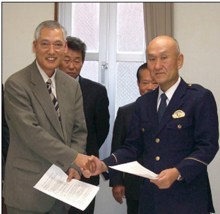
互いの協力を誓い固く握手する 会長(左)と江田島警察署長(右)

【商工会が地元警察署と地域安全に関する覚書を結び、防犯情報の共有化などを目指す】